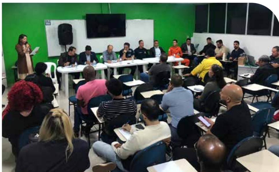
Audiência pública reuniu moradores, autoridades e representantes da sociedade civil para discutir oficialmente a implantação da Rua do Lazer em Águas Claras. O encontro ocorreu na Faculdade Unieuro e contou com votação favorável à proposta, ainda sem local definido.

Muitos administradores têm negligenciado essa realização, que deveria acontecer aos domingos e feriados. Somos extremamente favoráveis à implantação, mas não onde tem sido realizada, um lugar sem infraestrutura e sem comércio nas proximidades”, afirmou o presidente da associação.