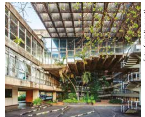
Sede da Reitoria UnB

" Se quero fazer pilotis, volumes em balanço ou estruturas em curva, então prefiro o concreto".