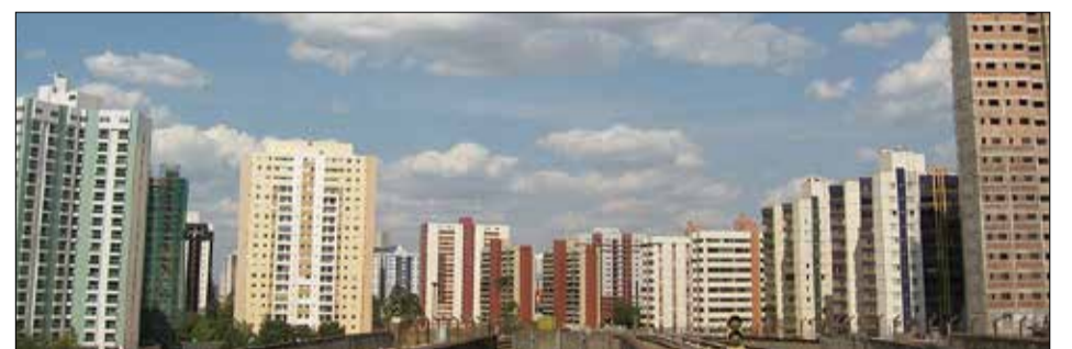
Vista parcial de Águas Claras

Pensamos em uma densidade de 300 habitantes por hectare. (...) Pensamos em 12 pavimentos e alteramos para 30. Isso aumentou a densidade populacional gravemente. Já que foi feito, é preciso revisão urgente do plano original para mitigar os conflitos. Águas Claras é uma cidade necessária. As pessoas gostam de morar lá. Sofrem com o transporte na hora de pico, porque o metrô não foi implantado no DF em totalidade razoável. Gostam de andar a pé, conversar nos botecos. A estrutura urbana agrada a população." Disse Zimbres no artigo que pode ser lido na íntegra no site do Correio Braziliense.