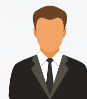
Reconhecimento facial/identificação de pessoas por idade ou características com relatórios precisos