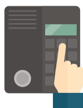
Controle de acesso