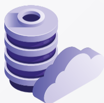
Armazenamento em nuvem