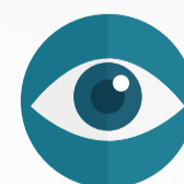
Visualização na escuridão total