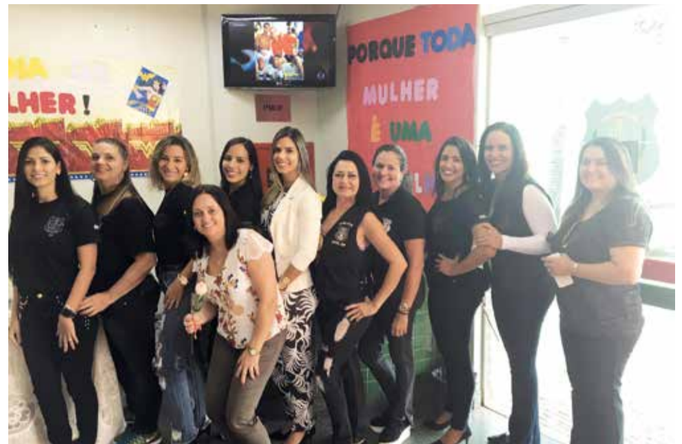
Equipe feminina da 21ª DF