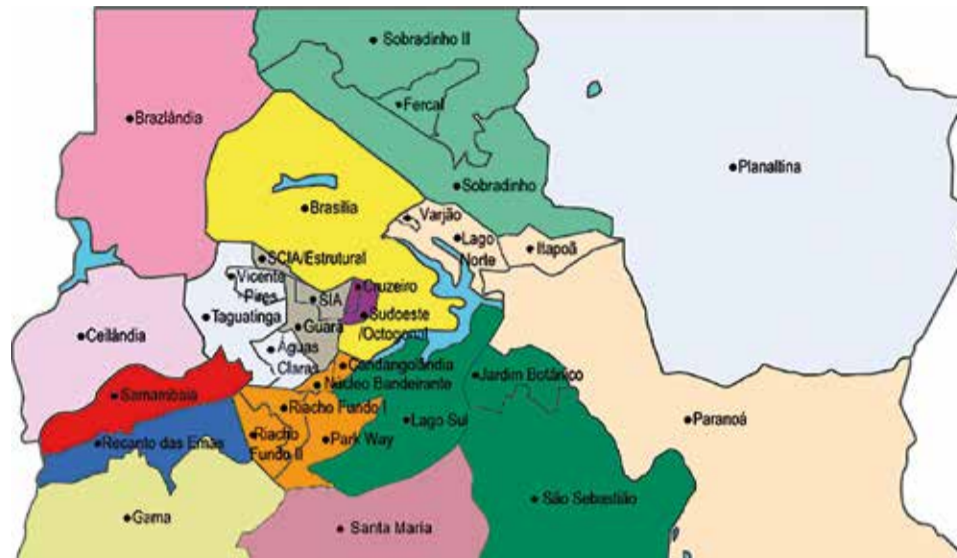
Mapa do Distrito Federal com as regiões administrativas

A expectativa é de que o projeto seja encaminhado para votação da Câmara Legislativa ainda no primeiro semestre de 2018, mas em ano de eleição pode ser que os candidatos não queiram se comprometer com um assunto tão polêmico. Nós vamos continuar acompanhando e aguardar a decisão definitiva.