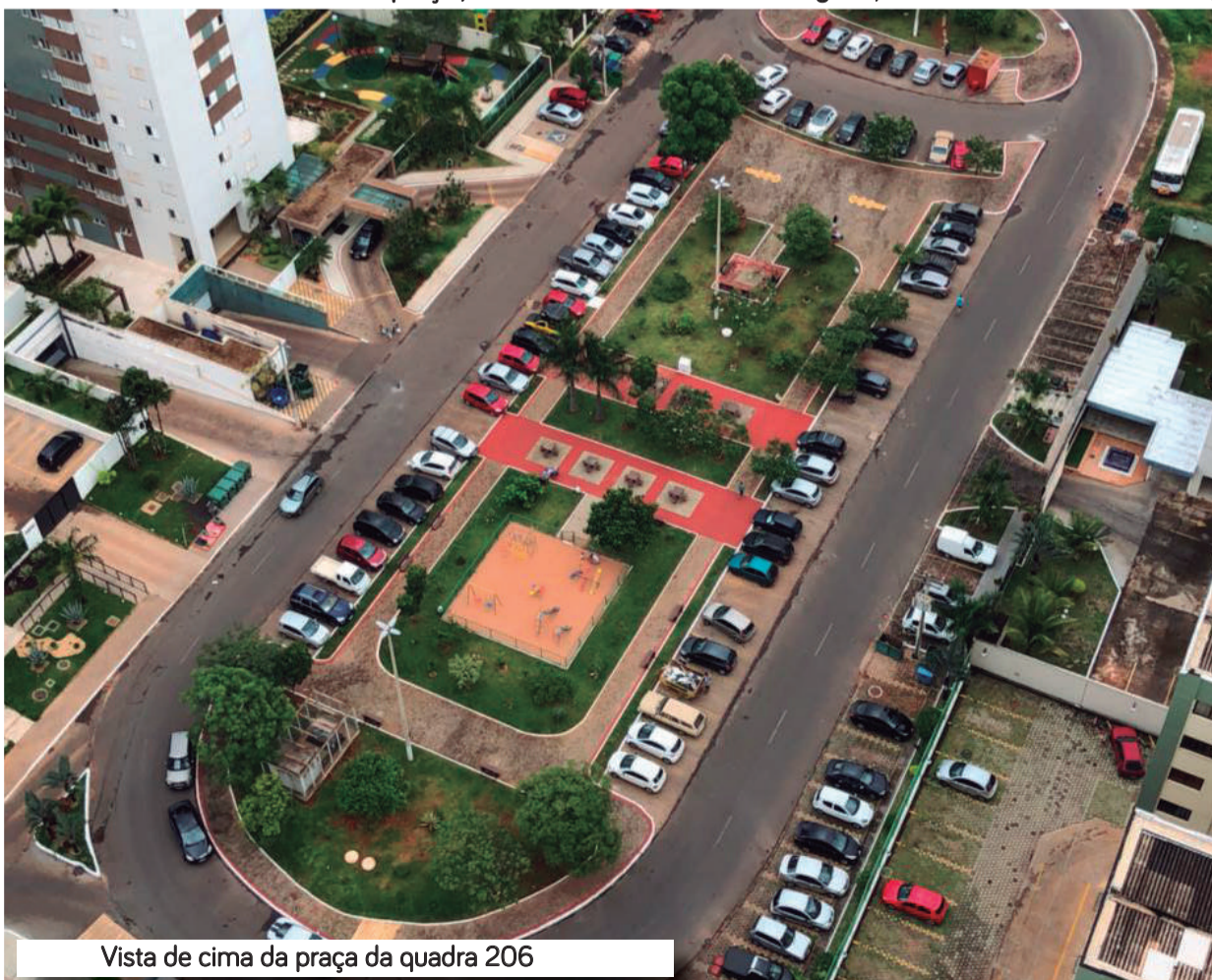
Vista de cima da praça da quadra 206

E você? O que tem feito pela sua cidade? Vamos seguir o exemplo de Udson?