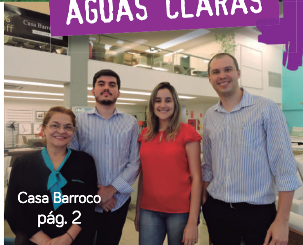
Casa Barroco pág. 2